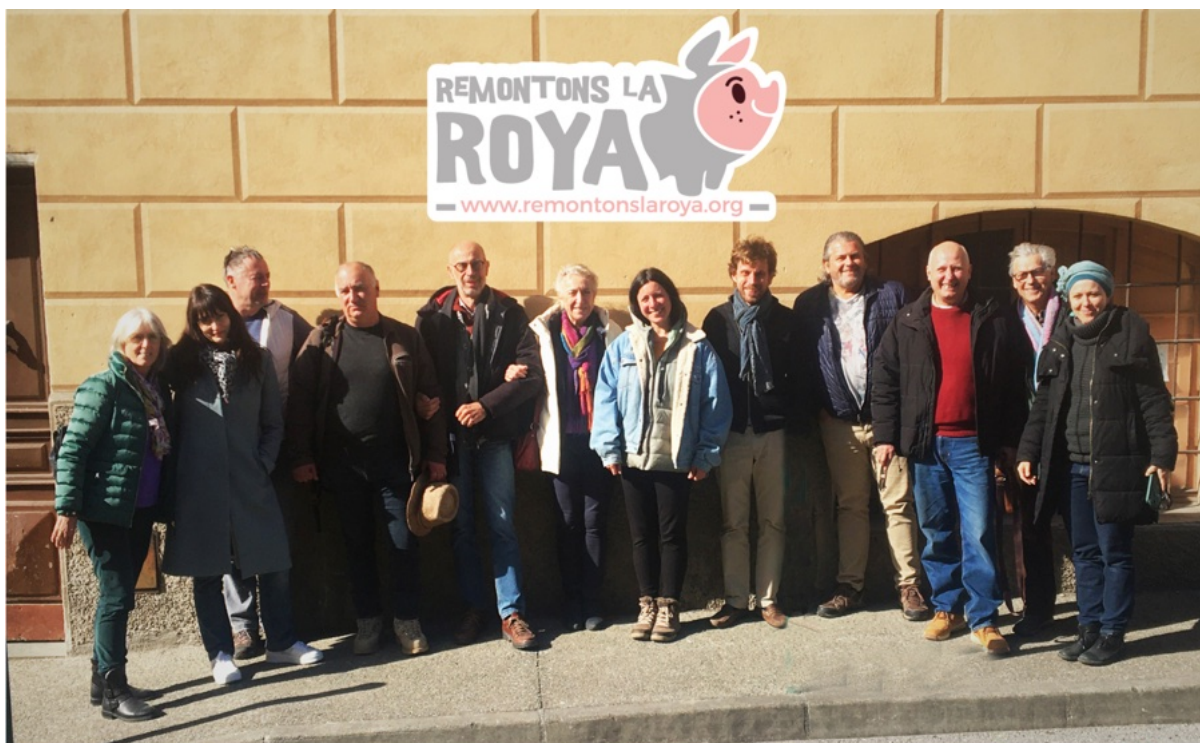
Illustration : Présentation des 3 salariés avec les 7 délégués du Conseil d'Administration de Remontons la Roya, le Maire de Fontan et Intermade devant les locaux de l'association en mars 2024.

En nous appuyant sur nos expériences vécues à travers nos actions depuis 2020, et grâce aux moyens que la Fondation de France nous a accordés, conscients du fait que ces défis ne peuvent être relevés sans une coopération entre tous les acteurs de notre territoire. Tout au long de l'année 2024, nous avons travaillé à la création d'une culture de la coopération, travail qui vise à poser les jalons du futur système valléen de coopération. Capable de fédérer les acteurs de la Roya, cette structure a le double objectif de promouvoir une vision commune et cohérente pour le développement de la vallée, dépassant les vecteurs de fragmentation existants, et permettant de recevoir des financements pour des projets territoriaux plus ambitieux.